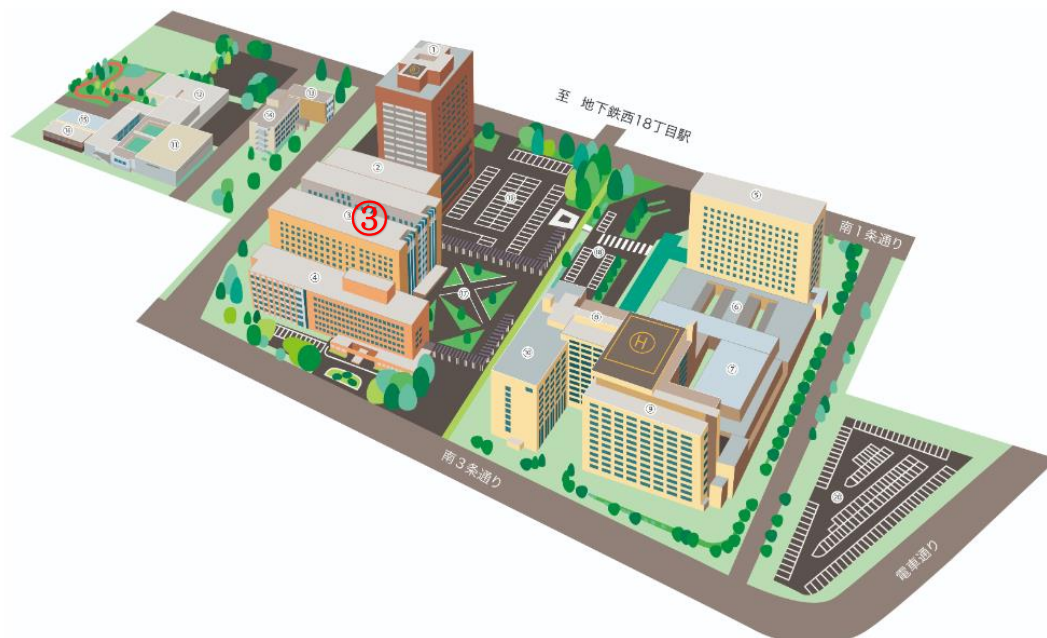
施設配置図(2023年1月時点)