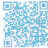
ユーザー会HP QRコード

ユーザー会HPに 登録いただきますと 講演スライドを ご覧いただけます 登録方法は 別紙参照ください