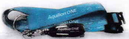
青いストラップがおしゃれな Aquilion ONE ストラップ付きUSB

ユーザー会HPから事前登録頂いた方には、 こちらの素敵なUSBをいずれか1点プレゼントいたします！