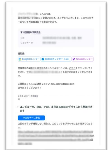
図2：登録完了画面（例）