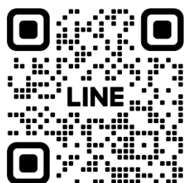
LINE QR コード

公式 LINE のアカウントができました！！最新情報や参加登録が簡単にできるようになります。ぜひご登録ください！